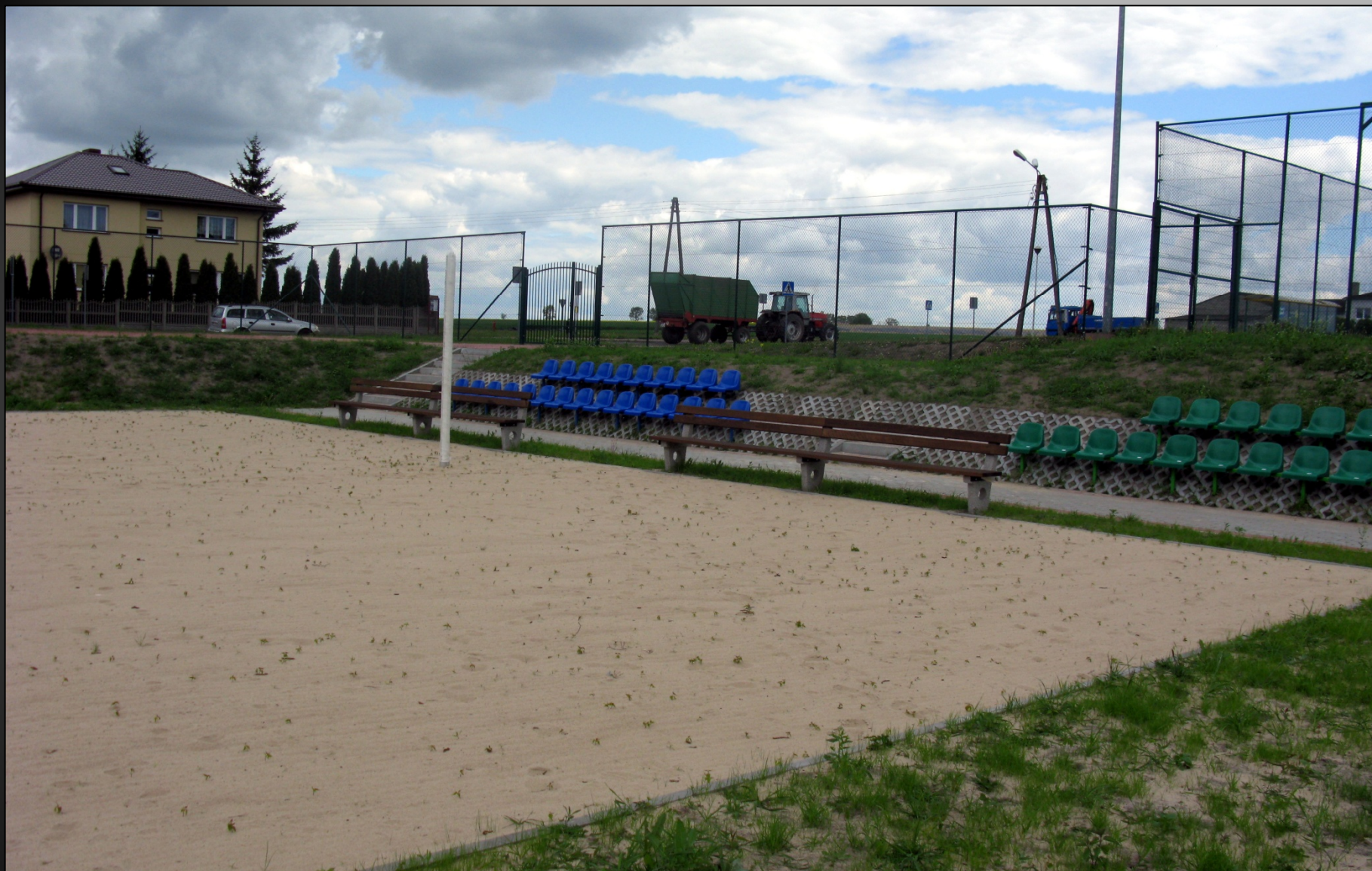
Kompleks boisk w Łubiance