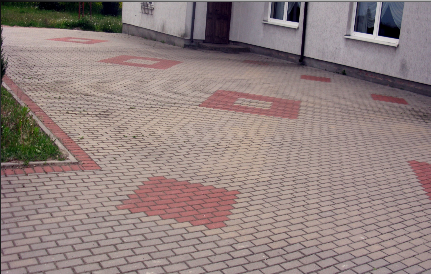
Plac przy świetlicy wiejskiej w Grabinie