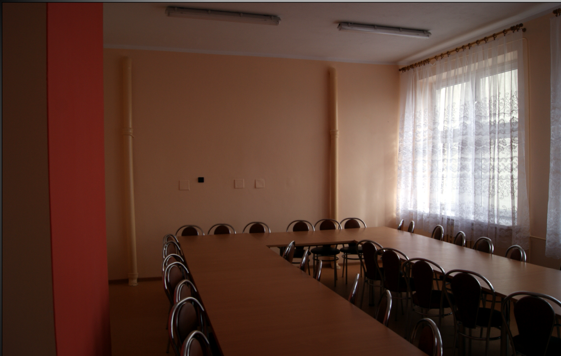
Sala świetlicy wiejskiej w Łubiance