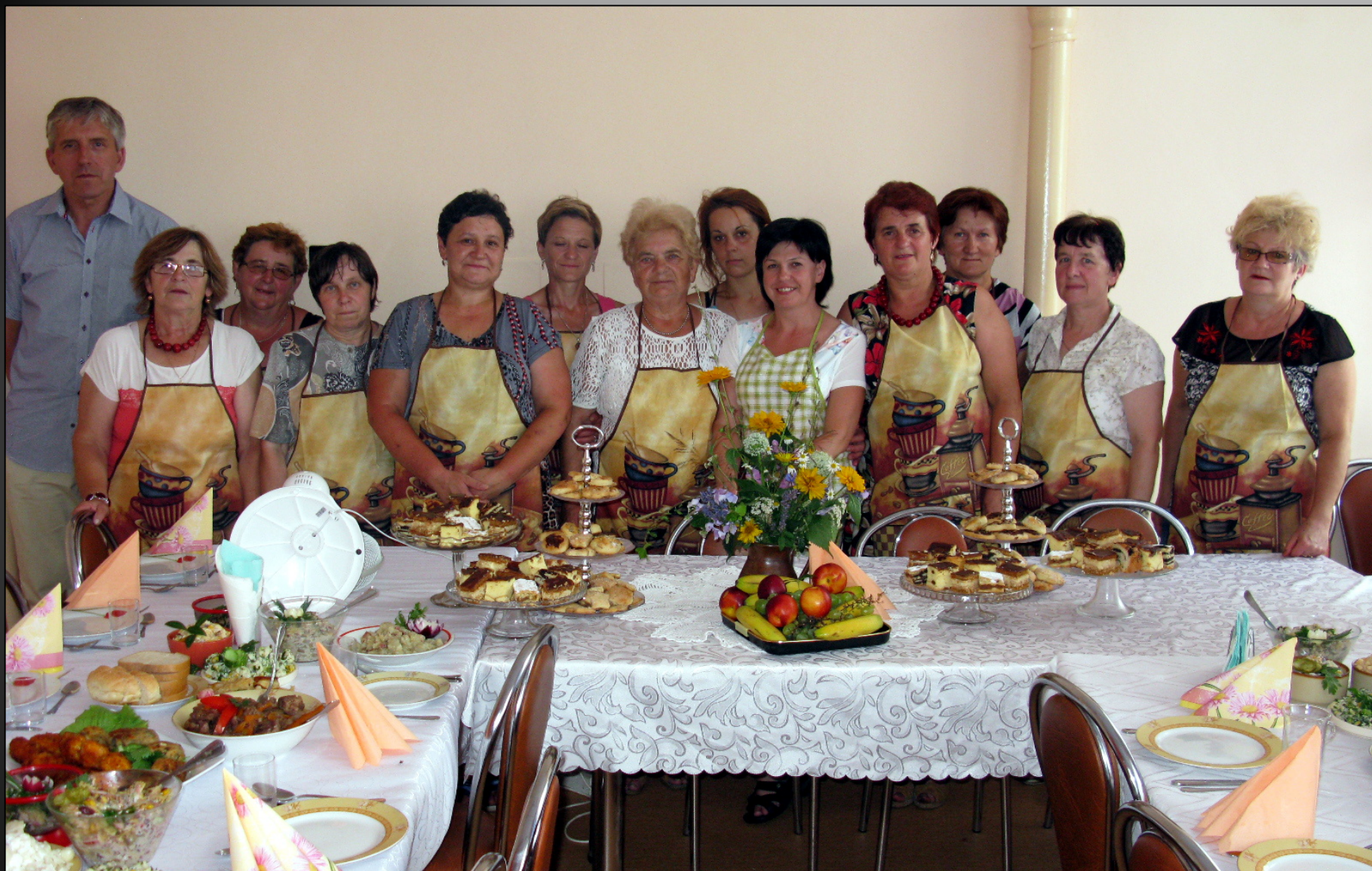
Sala świetlicy wiejskiej w Łubiance