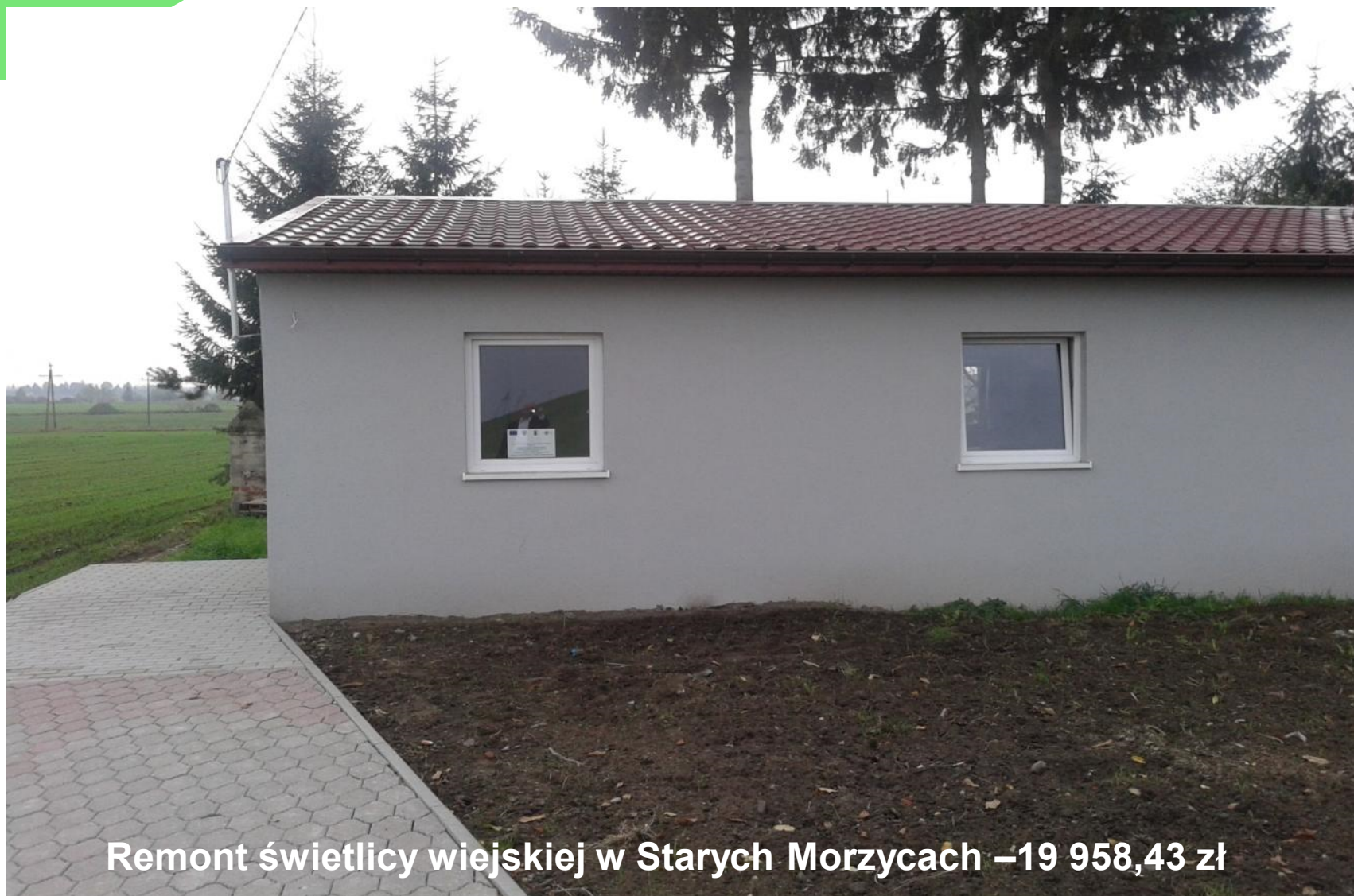
Remont świetlicy wiejskiej w Starych Morzycach –19 958,43 zł