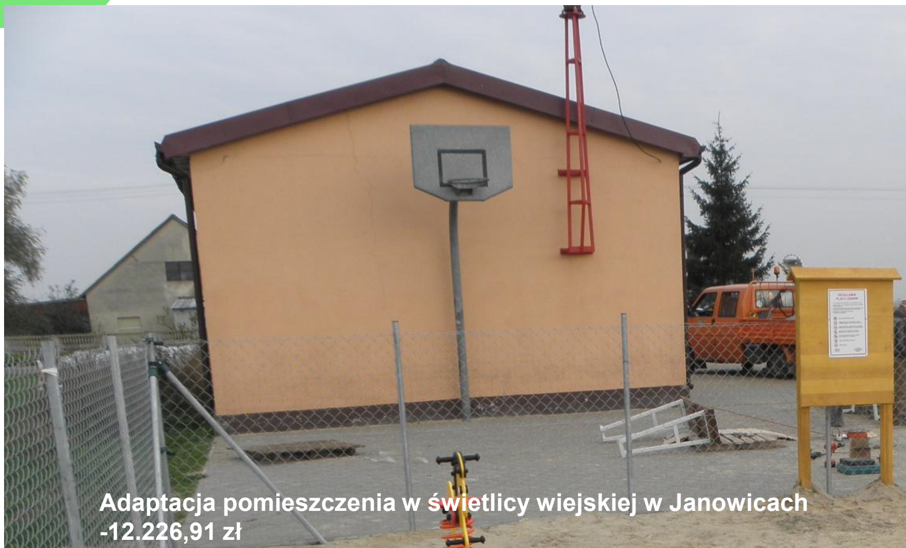
Adaptacja pomieszczenia w świetlicy wiejskiej w Janowicach -12.226,91 zł