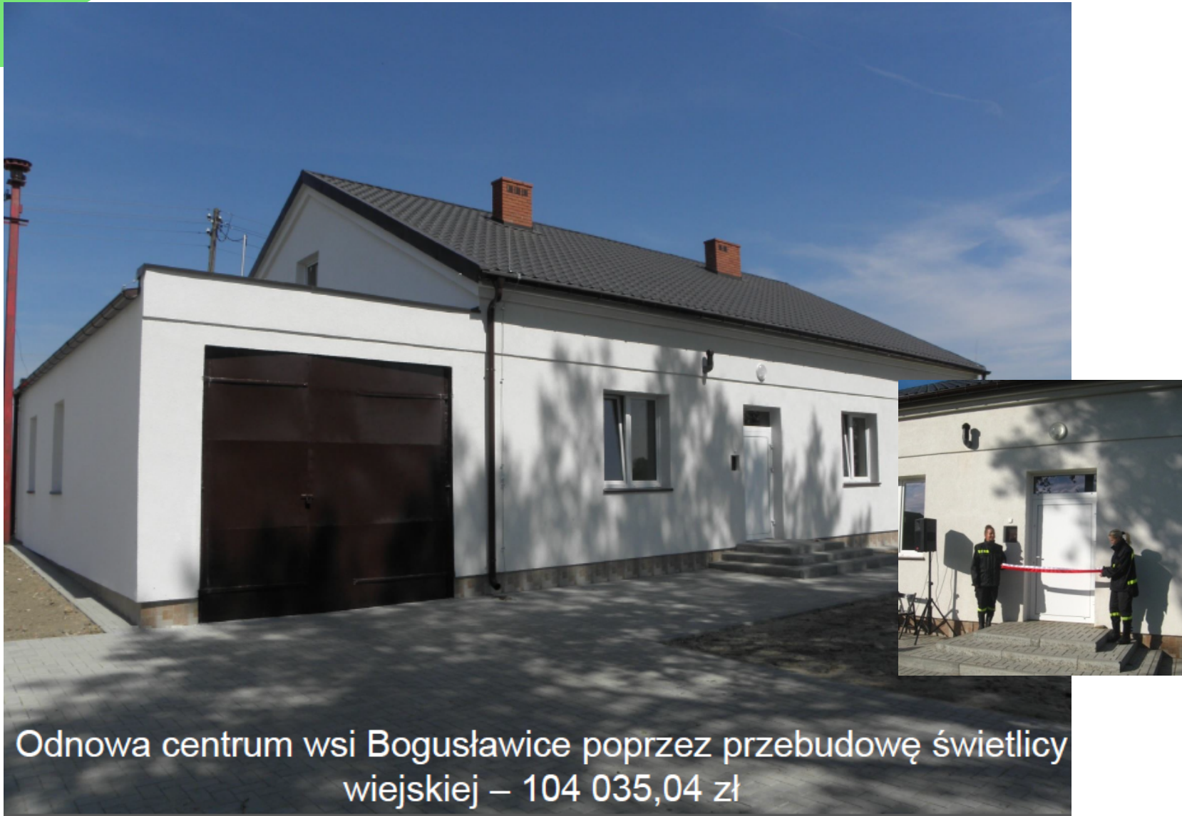
Odnowa centrum wsi Bogusławice poprzez przebudowę świetlicy wiejskiej – 104 035,04 zł